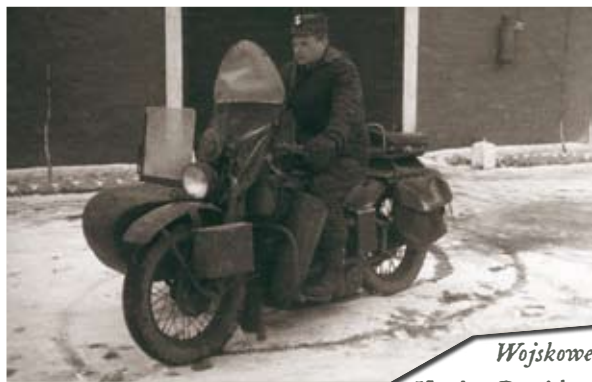
Wojskowe Harley-Davidson WLA w Ludowym Wojsku Polskim. Lata 40. i 50.

Wileńscy partyzanci na motocyklu Harley-Davidson WLA. Gdańsk 1945 rok. W tym czasie dowództwo Wileńskiego Okręgu Armii Krajowej przeniosło swoją konspiracyjną siedzibę do Gdańska, skąd kierowało dalszą walką, tym razem jednak przeciwko sowieckiemu okupantowi.